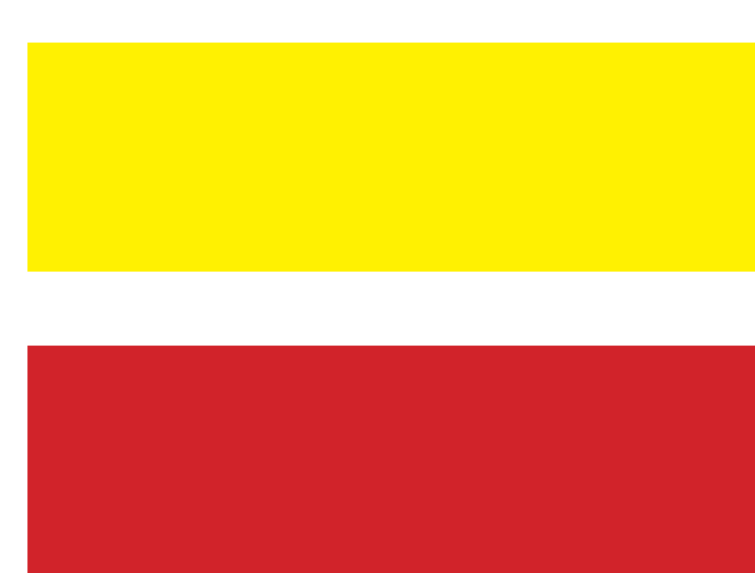
GRD itinéraires pédestres de grande randonnée de pays