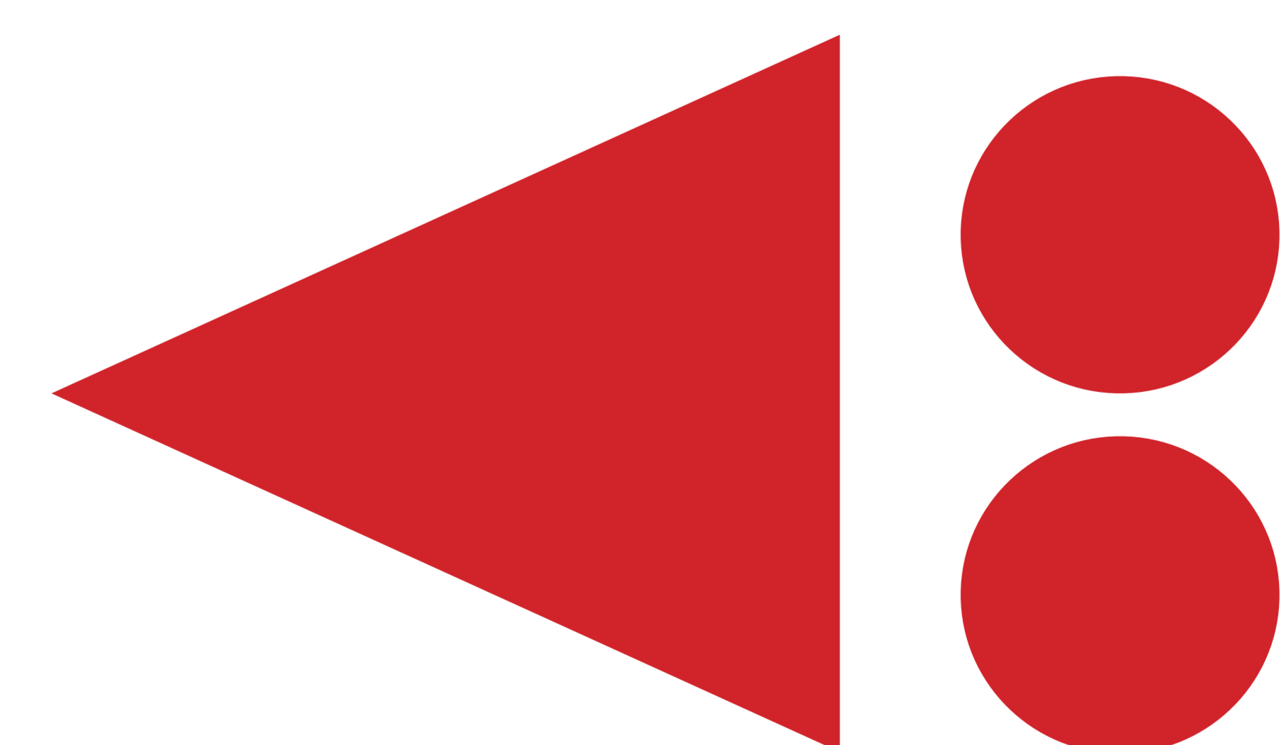
Grande traversée VTT ou circuit de plus de 80 km