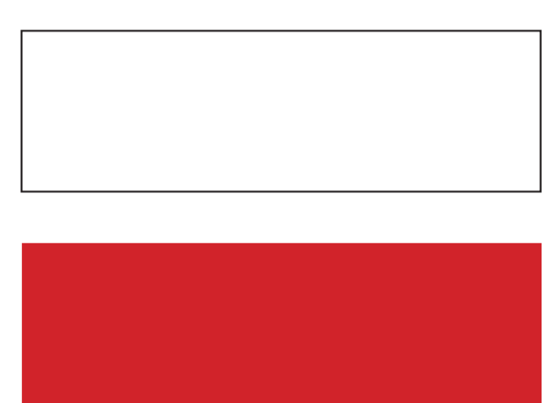
GR itinéraire pédestre de grande rando