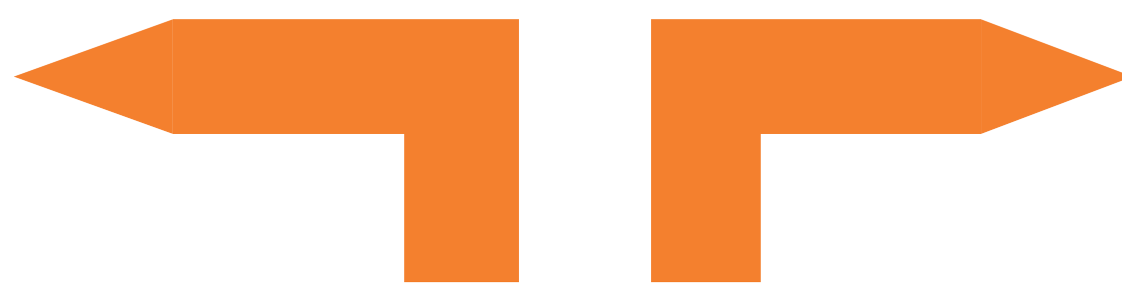
Changement de direction