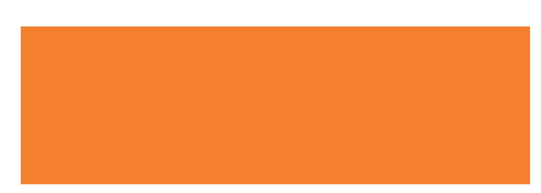
Itinéraire à suivre